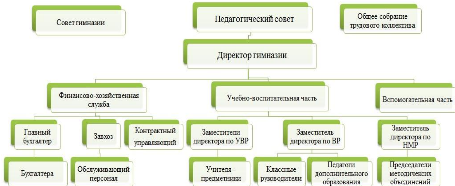
Схема структуры управления МБОУ гимназия № 2 г.о. Самара